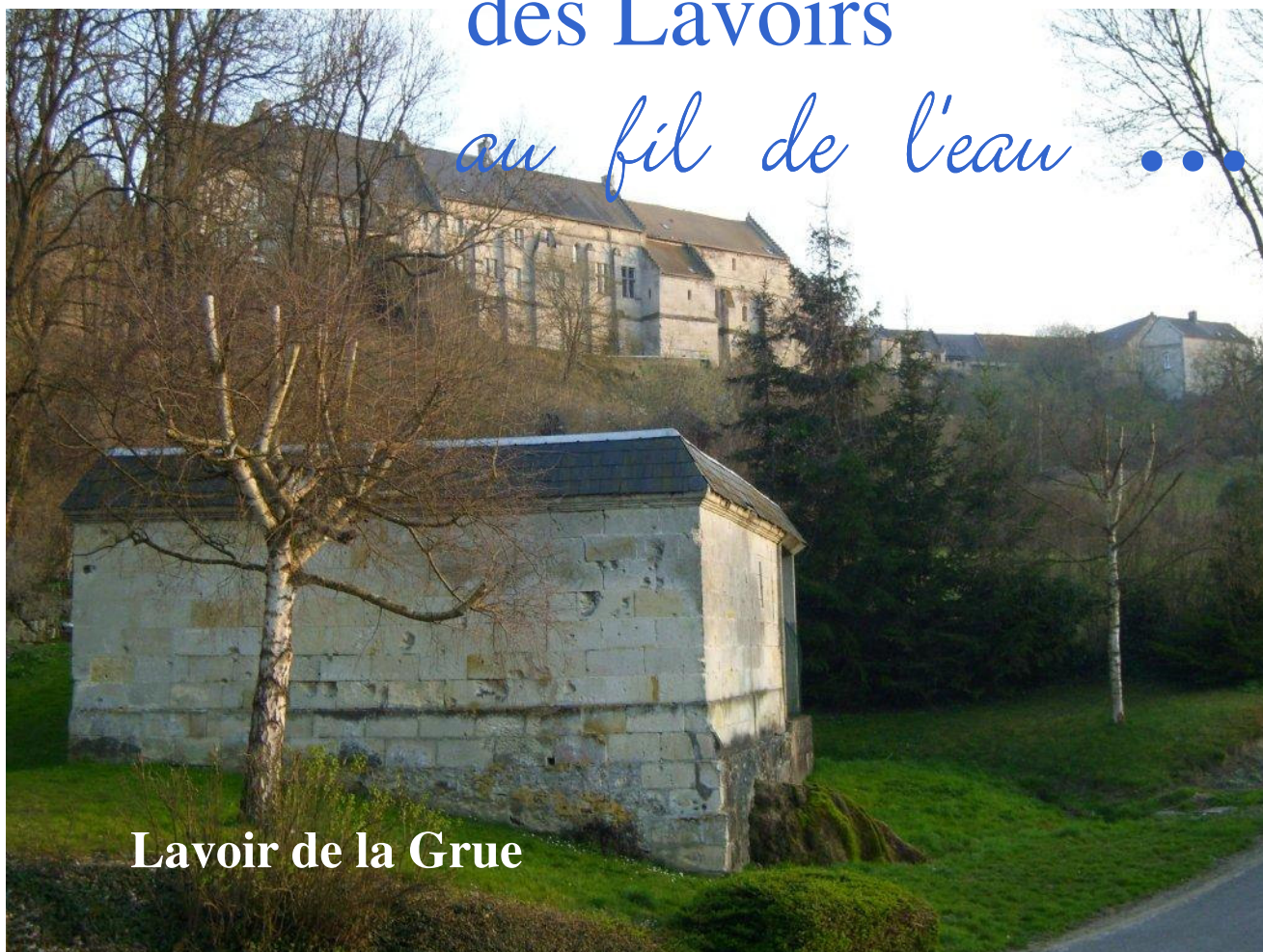
Lavoir de la Grue