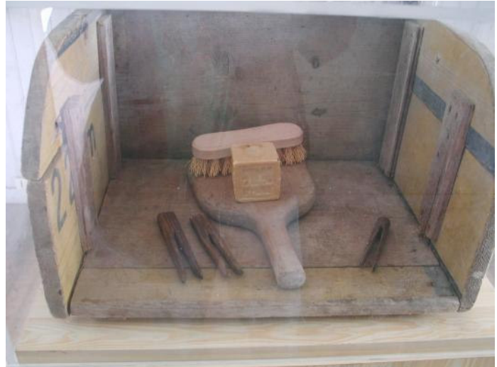
Outils de la lavandière: « carrosse » la caisse à laver, battoir, brosse ...