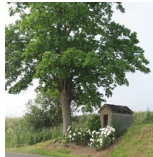
exemple dans une commune de la Somme : rosiers fleurissant les abords d'un petit édifice